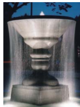
Fontaine Magritte, Bruxelles, Luca Maria Patella