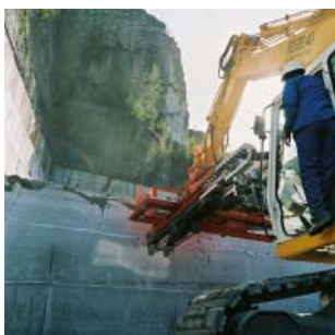
Forage à l'extraction