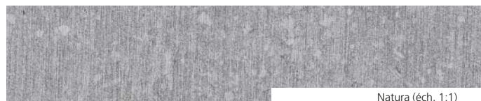
Natura (éch. 1:1)

Des dimensions hors standard ainsi que des conseils de pose et d'entretien peuvent être obtenus en faisant appel directement au producteur.