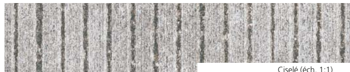
Cisé (éch. 1:1)