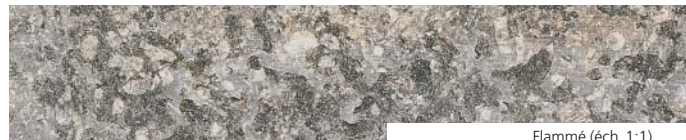
Flammé (éch. 1:1)