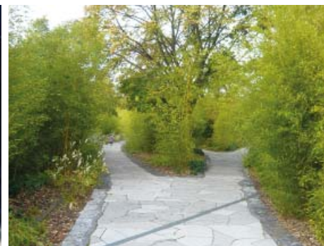
Jardin des Géants, Lille, arch. Mutabilis