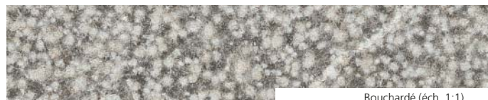
Bouchardé (éch. 1:1)