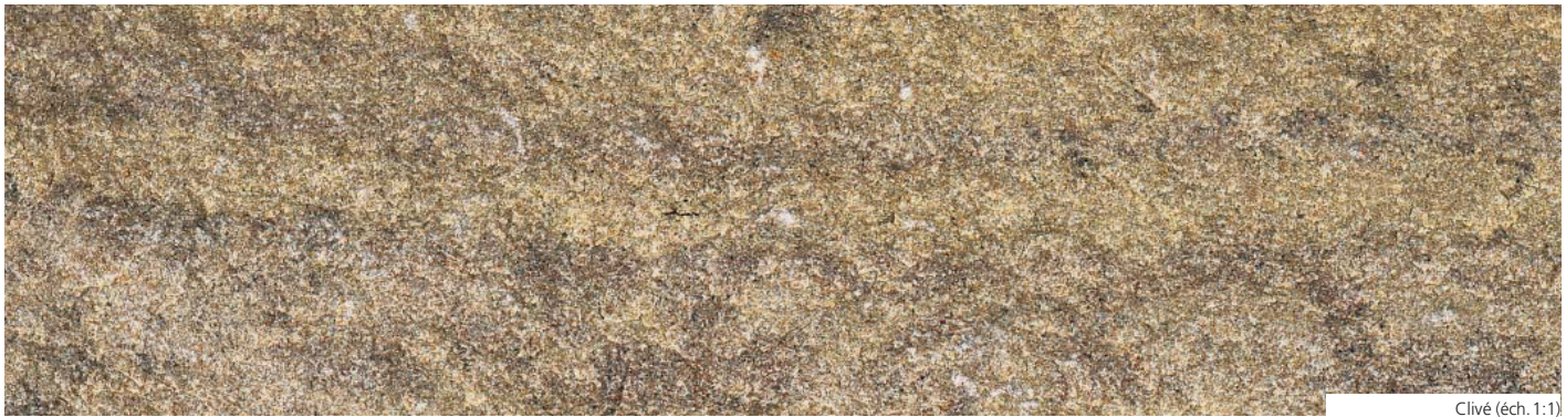
Clivé (éch. 1:1)