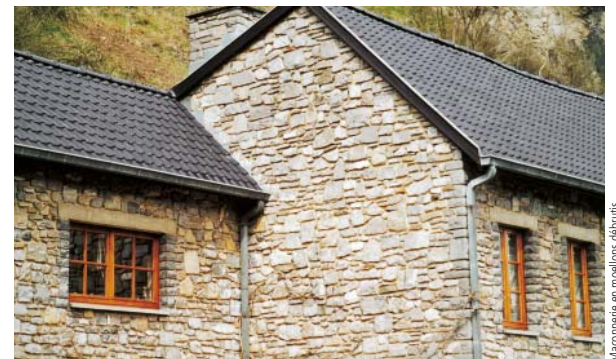
Maçonnerie en moellons débruits

«Calcaire à grain très fin de teinte noire, d'âge stratigraphique viséen inférieur (Carbonifère inférieur, Primaire)».