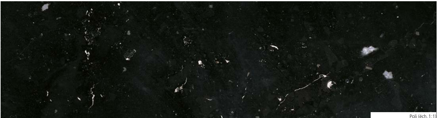
Poli (éch. 1:1)

Le calcaire de Salet (marbre noir de Dinant) est également utilisé dans la maçonnerie. Cette pierre acquiert une belle patine blanche, caractéristique des calcaires de Meuse. Actuellement, ces calcaires façonnés servent principalement à la restauration du patrimoine architectural ainsi qu'aux travaux de rénovation et de construction.