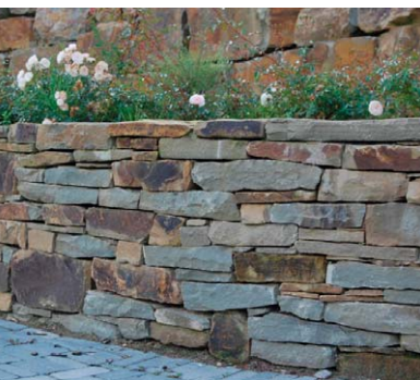
Place de Schoppen - Arch. Pays. Winters

Golf de Sterrebeek - Arch. B. Steensels / B. Smets