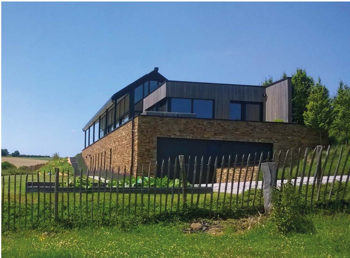
Projet privé - Arch. a.a.b. Bosquée