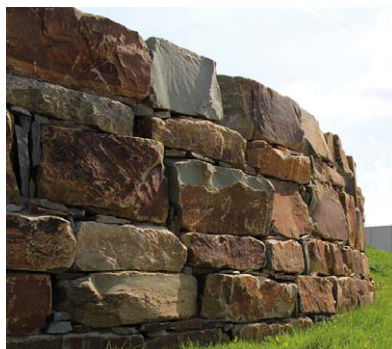
Golf de Sterrebeek - Arch. Pays. B. Smets