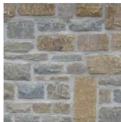
Moellons taillés d'équerre