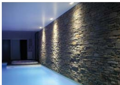
Projet privé - Arch. Audek & Partners