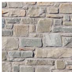
Moellons clivés dégrossis