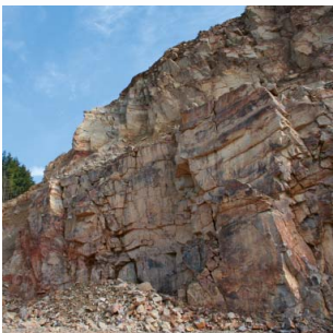
Carrière de la Warchenne - Weimes