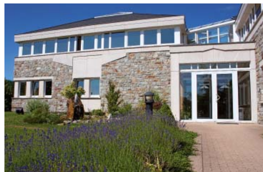
Malmedy, Bureaux Bodarwé, Arch. Jeunejean