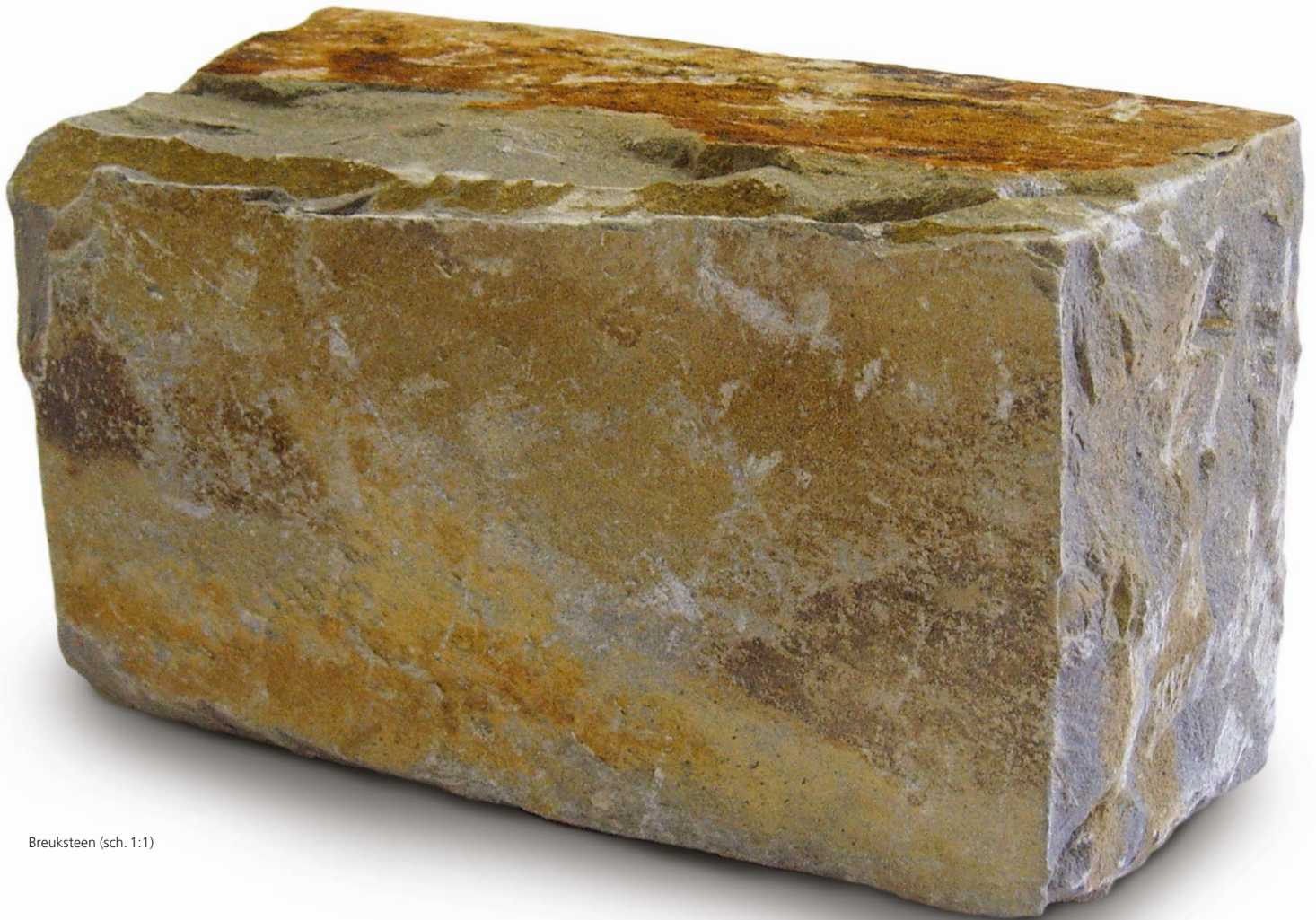
Breksteen (sch. 1:1)