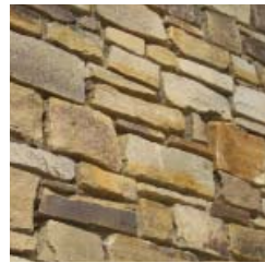
Grob behauenen Bruchsteinen