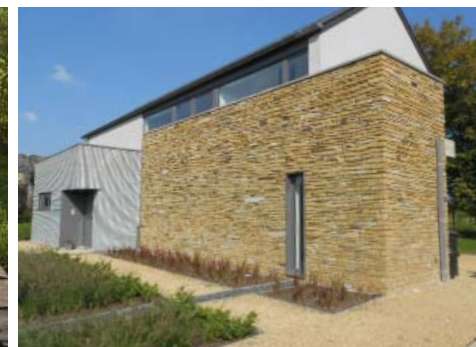
Kleine ausgewählte Mauersteine