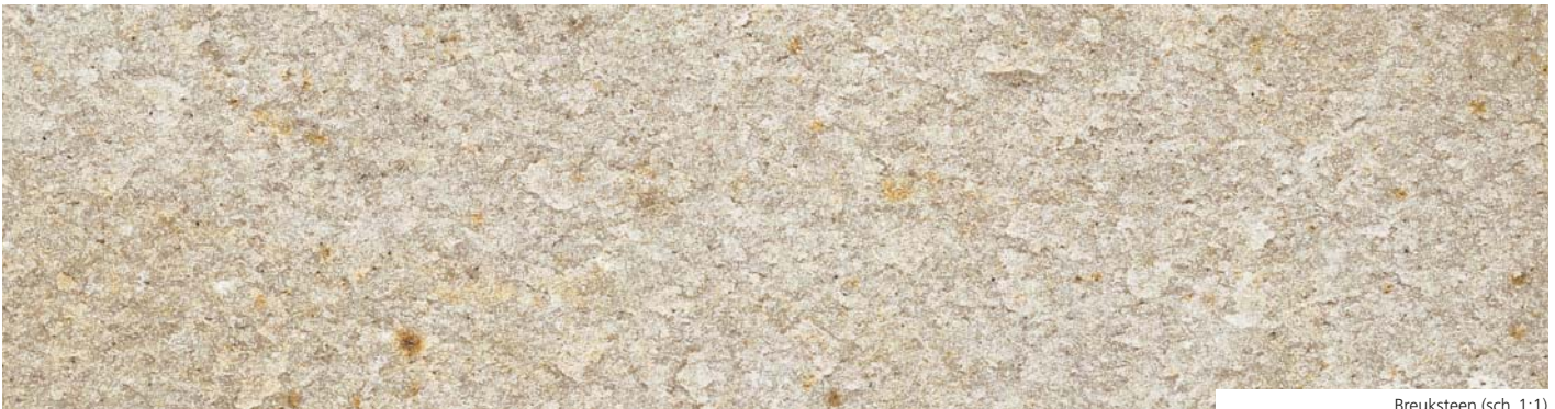
Breuksteen (sch. 1:1)

De zandsteengroeve behoort tot de lange lijst STEENGROEVEN VAN ESNEUX die gedurende eeuwen stenen leverden van een buitengewone mechanische kwaliteit.