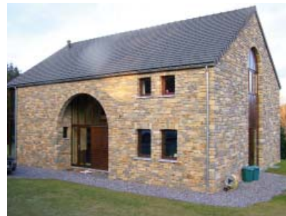
Arch. P. Dumez, zandsteen

De dikke zandsteenlagen vertonen een bijzonder breed kleurenpalet, met levendige tinten (geel, groen, rood, roestkleurig) of doffere kleuren (van grijsgroen tot blauwgrijs, wijnrood, oker, beige). Het patina van deze steen is roestkleurig als hij rijk is aan ijzer, en blauwgrijs of groenachtig als hij veel veldspaat bevat.