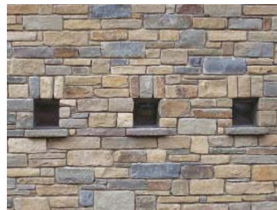
Arch. P. Dumez, zandsteen