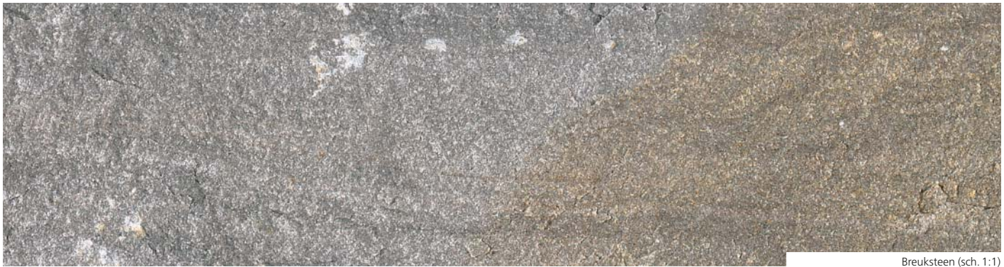
Breuksteen (sch. 1:1)