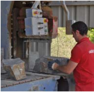
Opzuivering van breukstenen