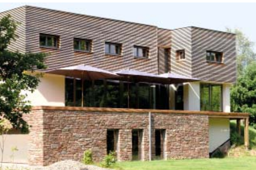
Stavelot, privé-woning passiefhuis, arch. www.ateam.be