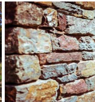
Waimes, Thirimont, privé-woning, arch. P. Guyot