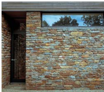
Beaufays, privé-woning, arch. www.crahsjamaigne.com