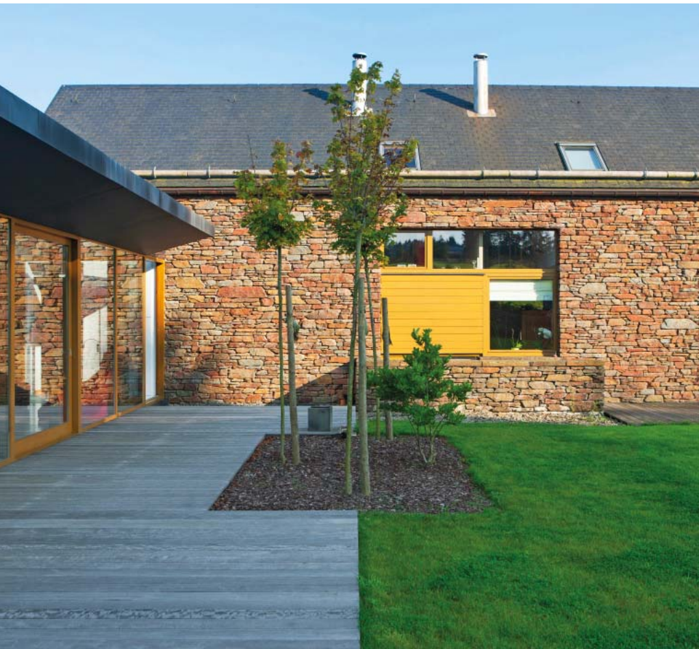
Xhoffraix, privé-woning, arch. www.cahayjamaigme.com