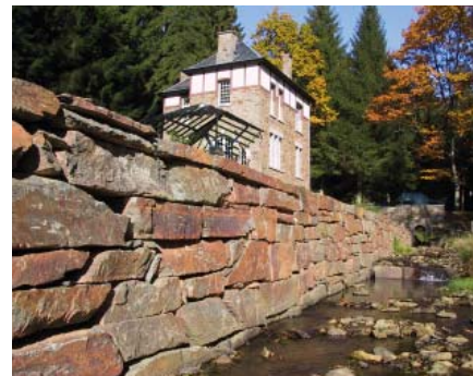
Manhay, Harre, Voorbeelden www.nelles-freres.com