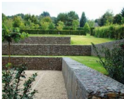
Vetsaïm, privé-tuin, schanskorven