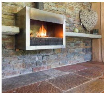
Walmes, Sourbrodt, Tuinbeurs