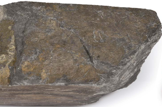
Breuksteen: schisteuze sandsteen

Het bedrijf heeft vandaag ongeveer 150 mensen in dienst en beschikt over een vrachtwagen- en machinepark dat voldoende uitgerust is om op een efficiënte manier de vraag naar zowel privé- als openbare werven te kunnen beantwoorden. Het vakmanschap en de betrokkenheid van onze medewerkers, alsook het gebruik van nieuwe technologieën, zijn de waarborg voor een uitvoering volgens de regels van de kunst.