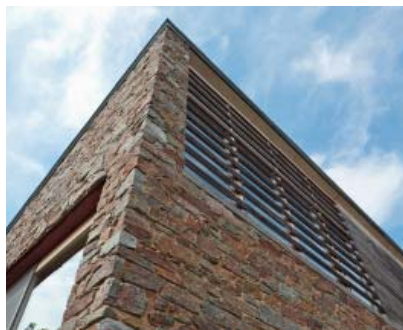
Hédoumont, privé-woning, arch. www.luc-nelles.be