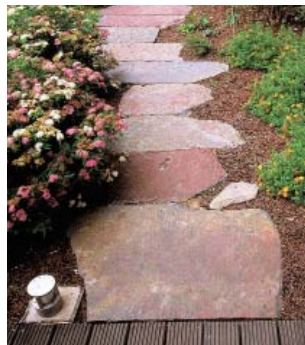
Xhoffraix, privé-woning, arch. www.luc-nelles.be