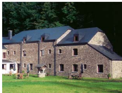
Laforêt, Hotel "Le moulin Simonis"