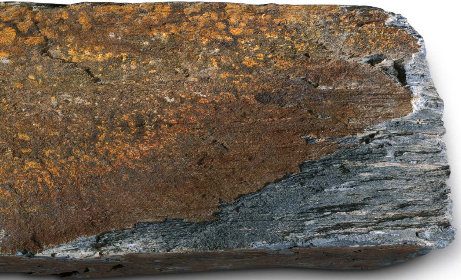
Bruchstein (Maßstab 1:1)