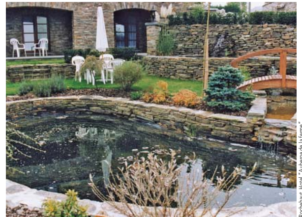
Rochehaut, Hotel "Auberge de la ferme"

Auskünfte über Sondergrößen und praktische Ratschläge zum Verlegen und Unterhalt sind beim Produzenten direkt erhältlich.