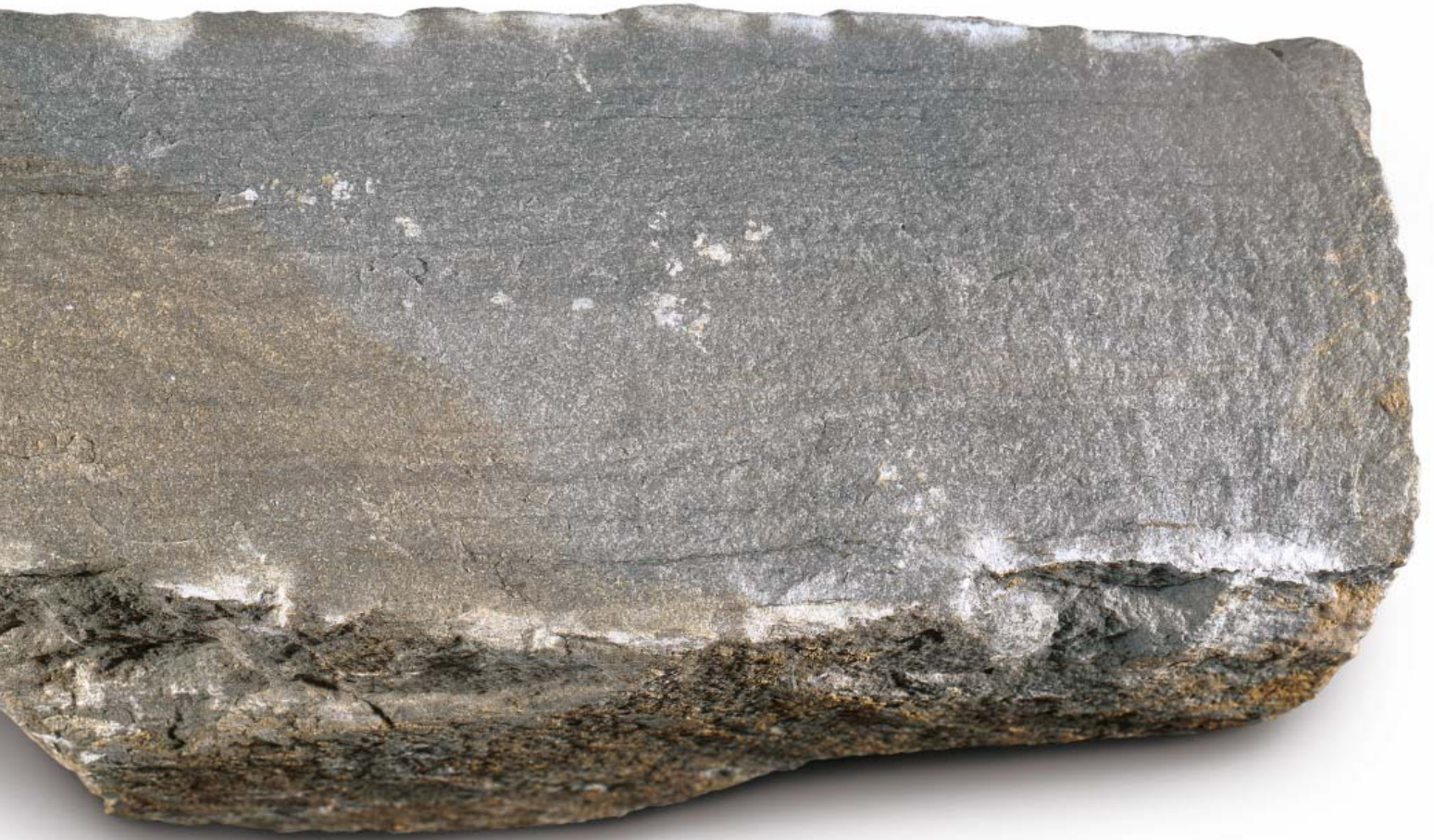
Bruchstein (Maßstab 1:1)