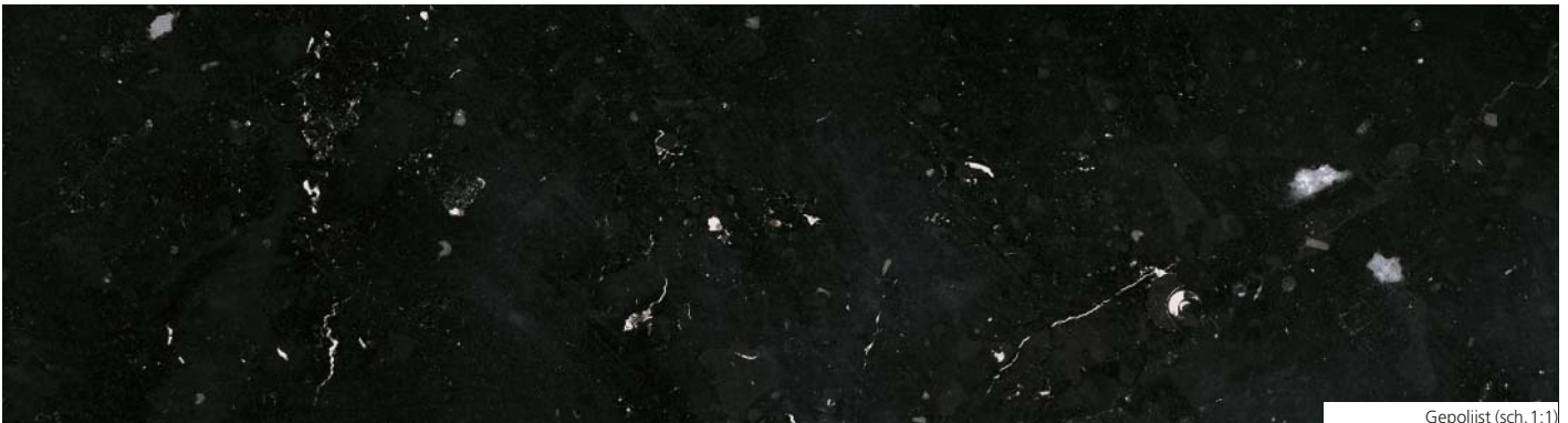
Gepolijst (sch. 1:1)

De kalksteen van Salet (zwart marmer van Dinant) wordt eveneens gebruikt voor breuksteen metselwerk. Hij krijgt een mooi wit patina dat vergelijkbaar is met dat van Maaskalksteen. Tegenwoordig wordt bewerkte kalksteen hoofdzakelijk aangewend voor de restauratie van het patrimonium en voor renovatie- en bouwwerken.