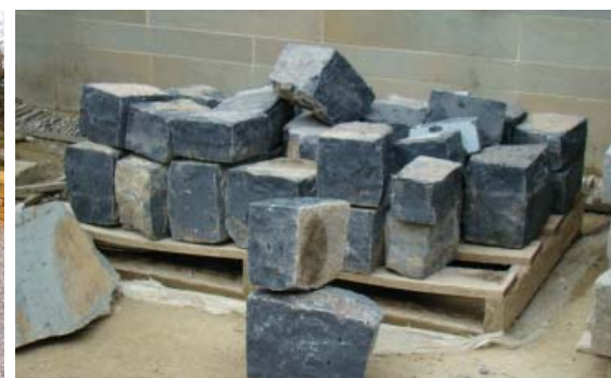
Maaskalksteen genaamd van Salet