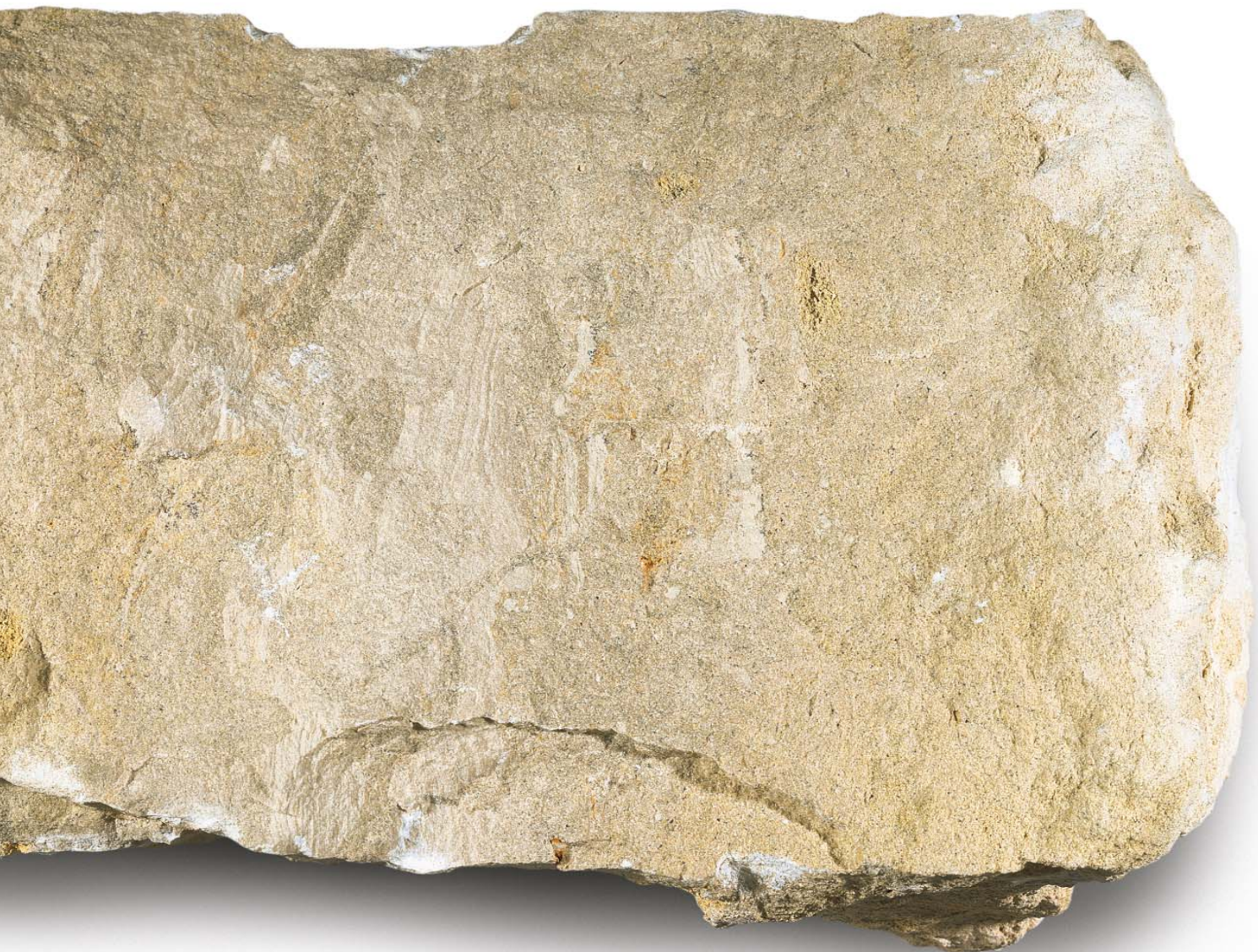
Breuksteen (sch. 1:1)