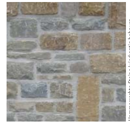
Hammerrechte Steine/viereckig behauen