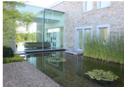
Photoprojekt - Arch. Spitz

Die äußerst reichhaltige Farbpalette der mächtigen Sandsteinlagerstätten enthält sowohl lebendigere Farben (gelb, grün, rot, rostbraun) wie gedämpftere Tönungen (von graugrün über graublau bis weinrot, ockergelb oder beige). Je nach dem ob der Stein stark eisenhaltig ist oder viel Feldspat enthält, nimmt er eine rostbraune und graublau oder grünliche Patina an.