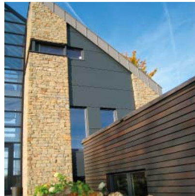
Photoprojekt - Arch. Eichler