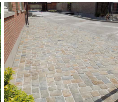
Renaix - Grundplatten / Kopfsteine