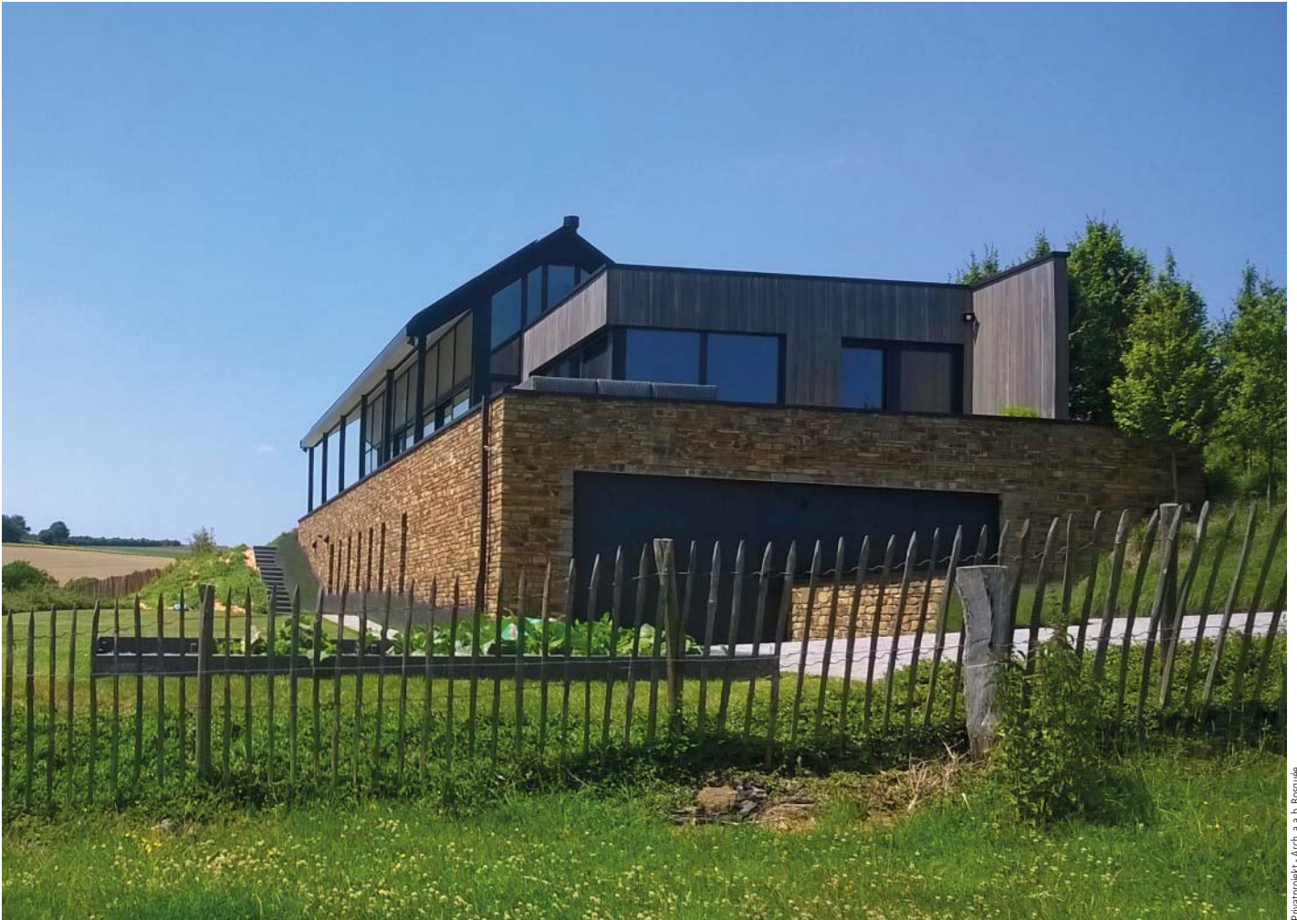
Privatprojekt - Arch. a. a. b. Bosquée