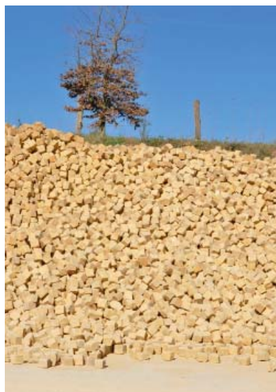
Platen 9-11 cm