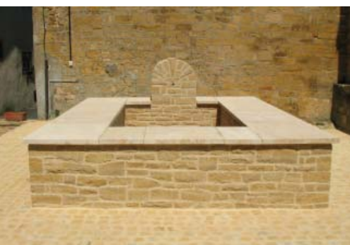
Fontein, Marville (F)