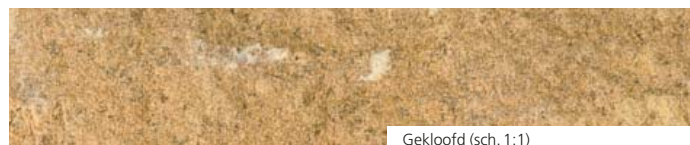
Gekloofd (sch. 1:1)