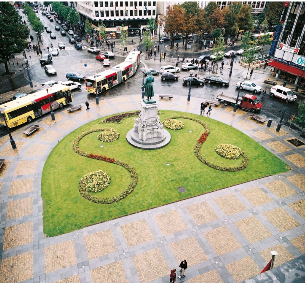
Luik, place de l'Opéra, arch. Claude Strebelle, 2000