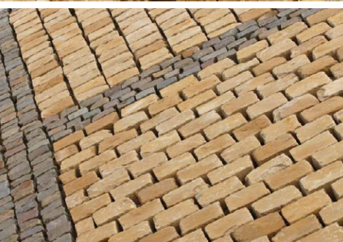
Fontein, Marville (F)