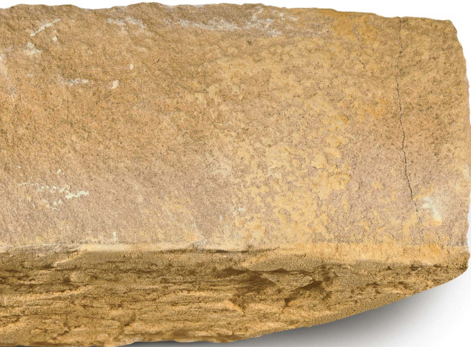
Breksteen (sch. 1:1)