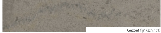
Gezoet fijn (sch. 1:1)

De talrijke mogelijke behouwingen en afwerkingen, alsook de brede waaier van afmetingen bieden tal van toepassingsmogelijkheden, zowel binnen als buiten en maken dit gesteente zeer gewaardeerd: grondmuren, gevelafdekstenen, breukstenen, muurbedekking, tegels en straatstenen voor buitentoepassing, boordstenen, drempels, omlijsting van muuropeningen, venster-tabletten, trappen, vloertegels, bekleding van binnenmuren, plinten, werkbladen, dekstenen voor bruggen, steenbestorting, stadsmeubilair, evenals alle marmer-toepassingen, behouwingen, en beeldhouwwerken.