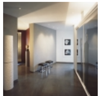
Brussel - Appartement, arch. M. Corbau - 2000

steen en veroorzaakt door het hoge kalkgehalte. Bij slijpen of polijsten verkrijgt de Longpré kalksteen een mooie middel- of donkergrijze kleur die wordt gewaardeerd om zijn uniformiteit. Deze kan zowel worden gebruikt voor dunne elementen als voor artisanale doeleinden, meubelonderdelen, trap treden, enz.