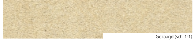
Gezaagd (sch. 1:1)

«Zanderige kalksteen uit het Sinemuriaan (Lias, Onder-Jura, Secundair)».