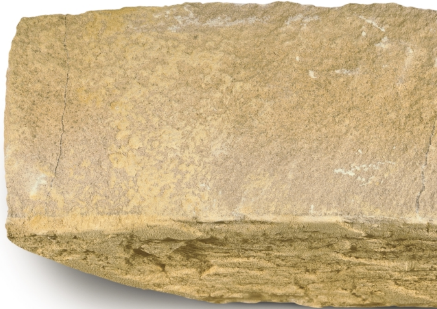
Breuksteen (sch. 1:1)

Gekloofd, opgezuiverd, gezaagd of geslepen.