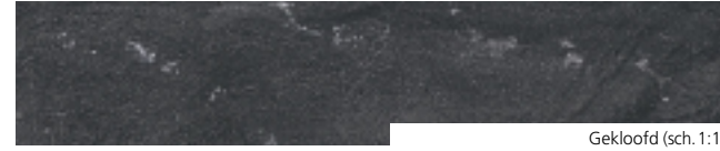
Gekloofd (sch. 1:1)

«Zeer fijnkorrelige zwarte kalksteen uit het Onder-Viseaan (Onder-Carboon, Primair)».