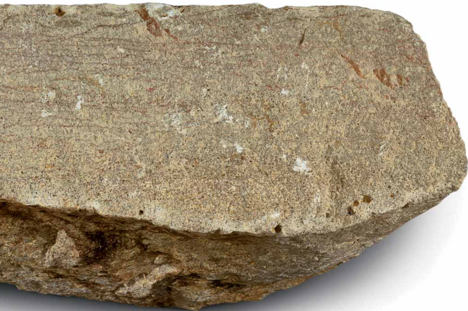
Breksteen (sch. 1:1)