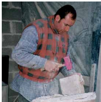
Steenleveraar aan het werk