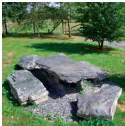
Tafel en banken