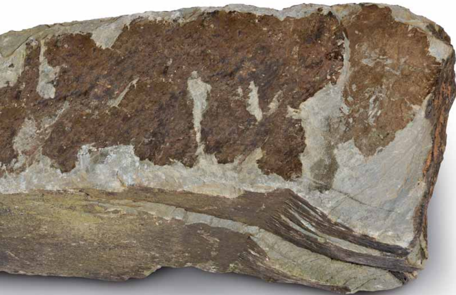
Breuksteen (sch. 1:1)