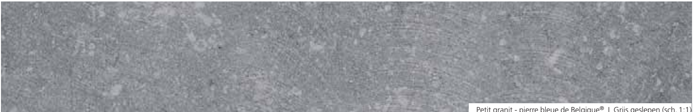
Petit granit - pierre bleue de Belgique® | Grijs geslepen (sch. 1:1)

De CHANSIN-STEENGROEVE ligt in de vallei van de Bocq, dicht bij het gehucht Chansin. Het arduin dat er wordt ontgonnen en door zijn vindplaats "Bocq blauwe hardsteen" wordt genoemd, is uniek in België en onderscheidt zich van de andere blauwe hardsteen door zijn blauwachtig uitzicht, bepaalde concentraties van crinoïden en fossielen en de diepzwarte kleur die het na het polijsten krijgt.