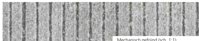
Mechanisch gefrijnd (sch. 1:1)

Voor niet-standaard afmetingen en voor advies inzake plaatsing en onderhoud kunt u rechtstreeks bij de producent terecht.