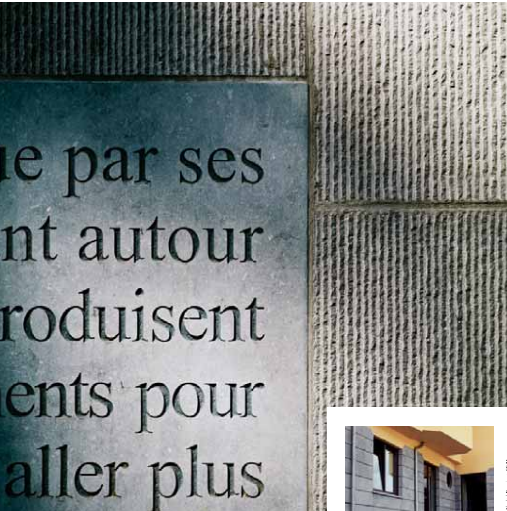
Jambes, flaggebouw, 1999

Brussel, square M. Yourcenar, arch. A.V.A., 1999