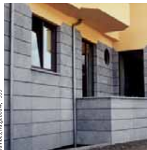
Dinant, handelszaak, arch. Dimitri Bourchat, 2001