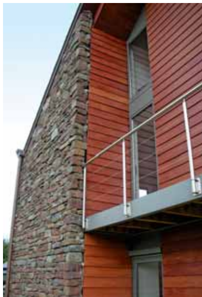
Chaîneau, privé-woning, arch. V. Salmon