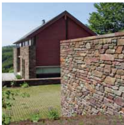
Xhofferix, privé-woning, arch. L. Nelles