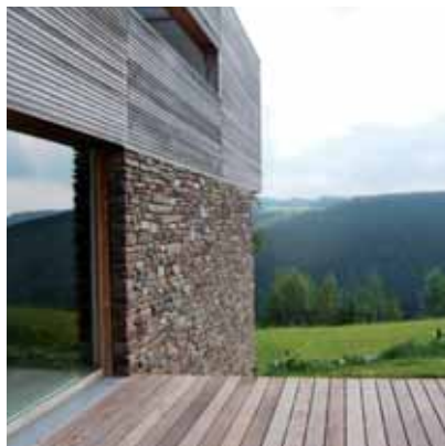
Chôdes, privé-woning, arch. www.craibajamaigie.com