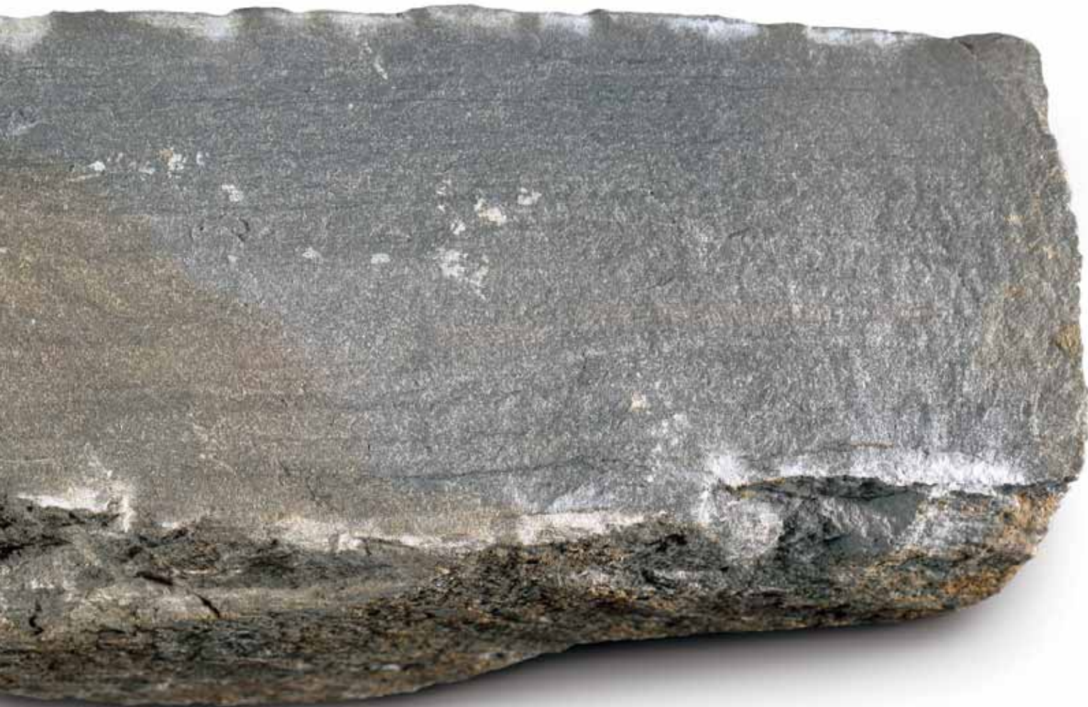
Breuksteen (sch. 1:1)