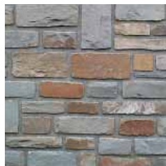
Breukstenen haak gekapt