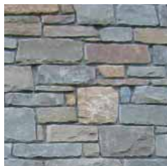
Breukstenen met de grote hamer gekapt