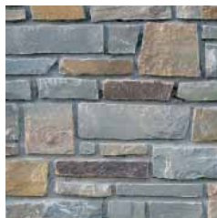
Breukstenen half behouwen gewoon gekapt