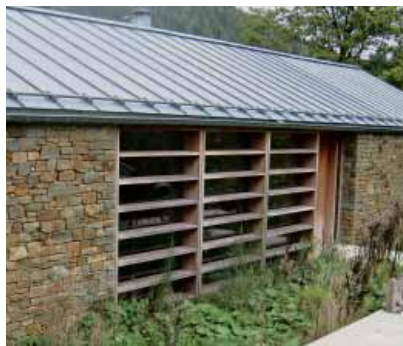
Leneuve - Arch. Richard