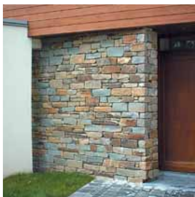
Thimister - Arch. Letotte