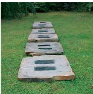
* Lucarnes*, beeldhouwer A.-M. Klernes, 2000