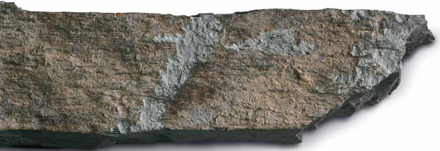
Breksteen (sch. 1:1)