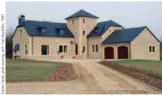
Sainte Cécile, privé-woning, arch. Yves Boulefeu, 1991