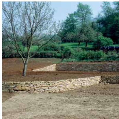
Awieth (F), tuin, 1997