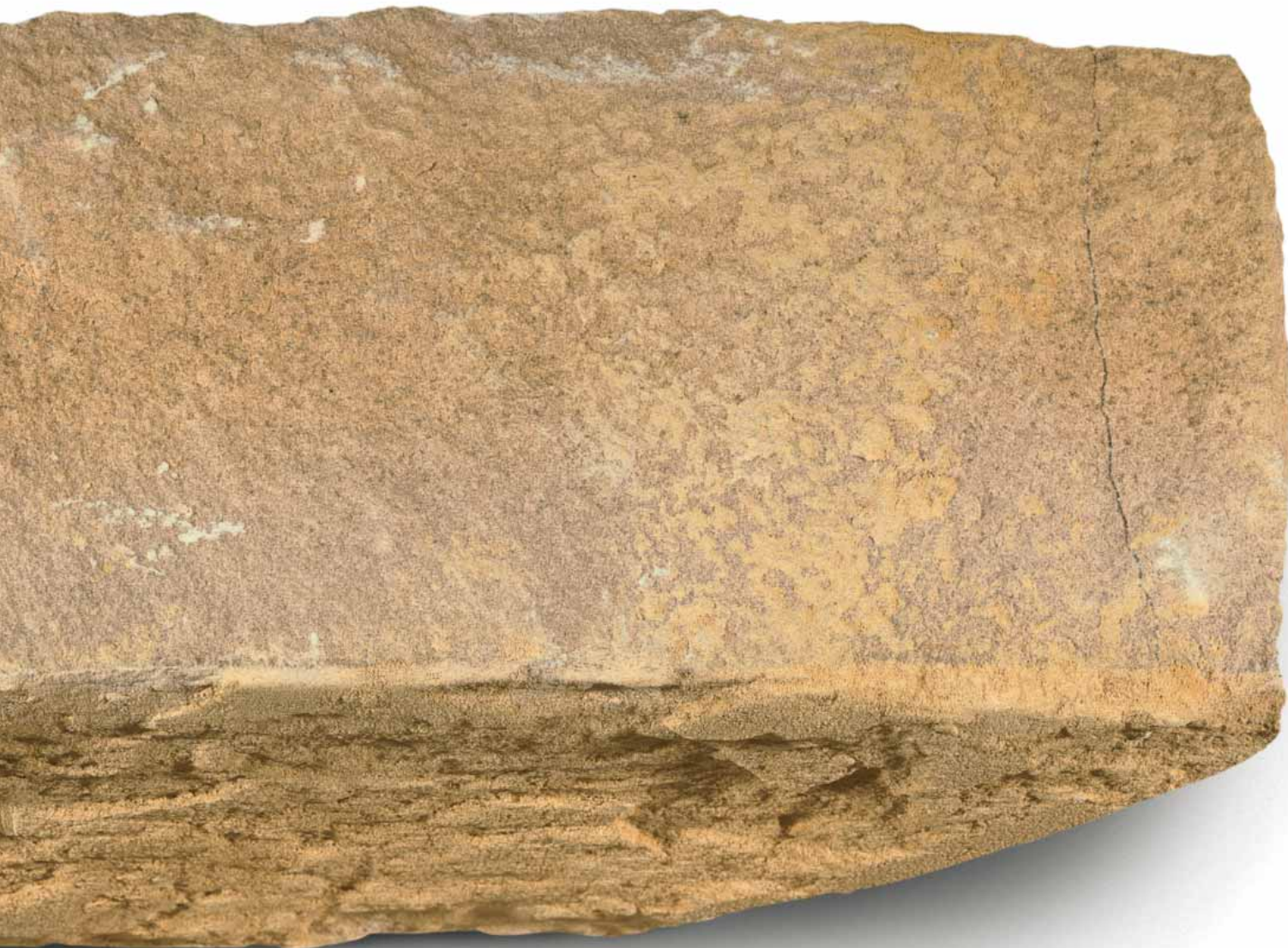
Breksteen (sch. 1:1)