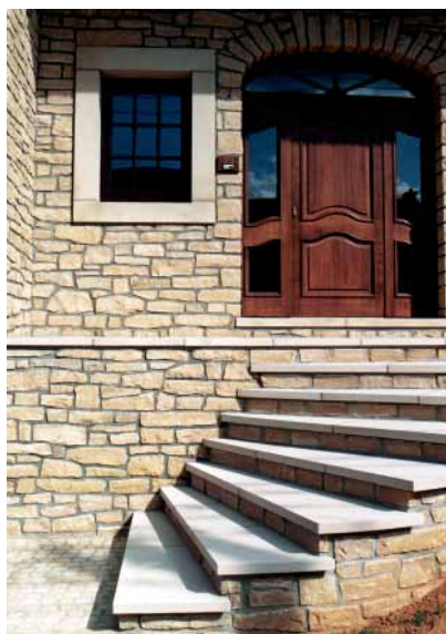
Ailon, privé-woning, 2000