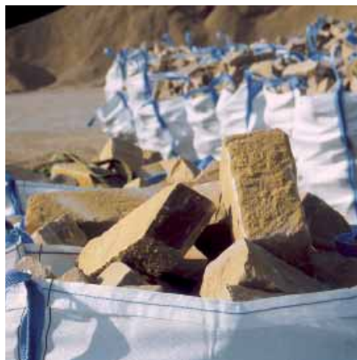
Brekstenen in big-bag