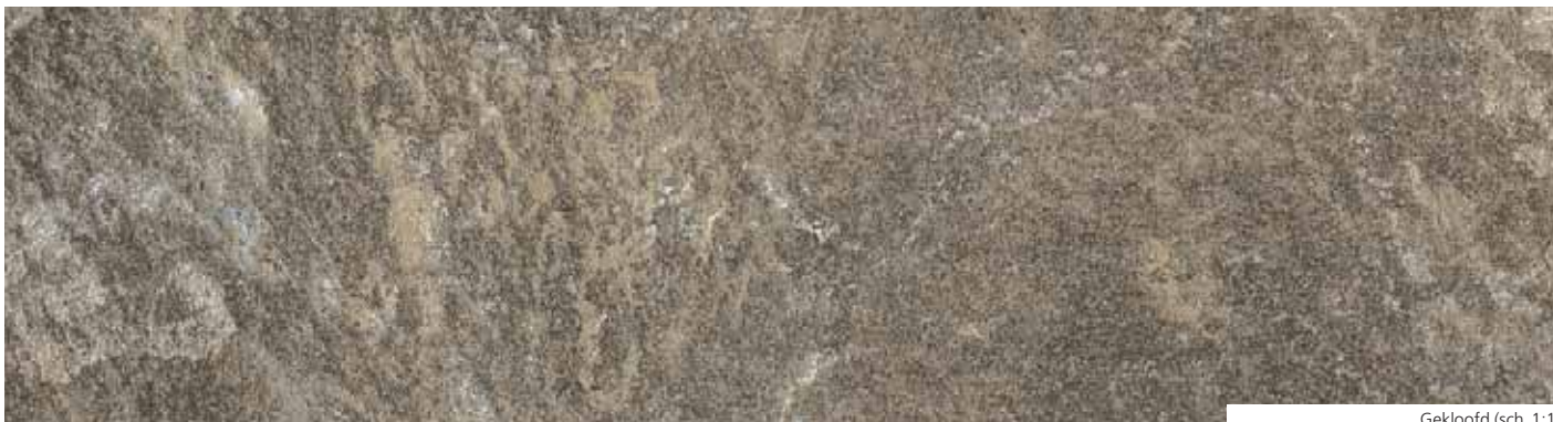
Gekloofd (sch. 1:1)