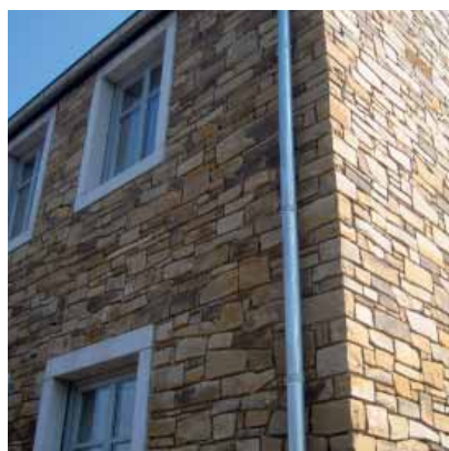
Murets bruts taille artisanale