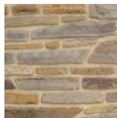
Murets bruts naturels