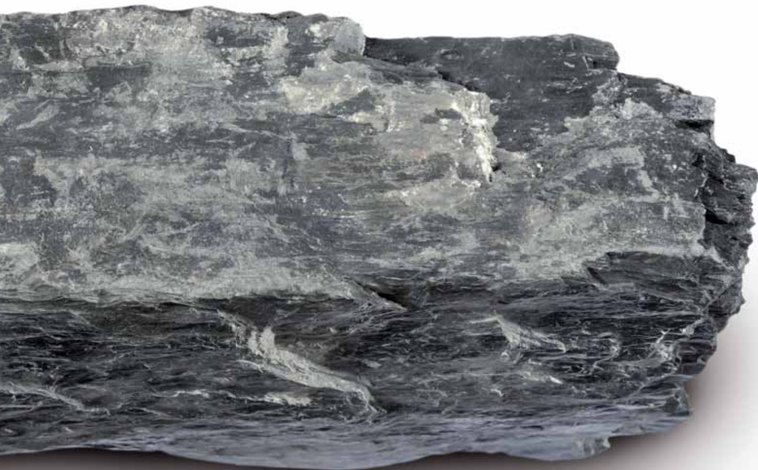
Moellon (éch. 1:1)