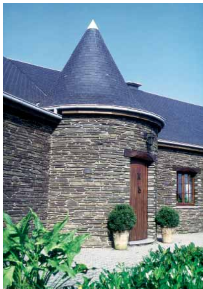
Six-Flanes, maison privée