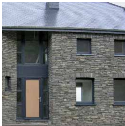
Maison privée Lambert