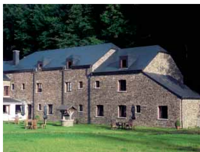
Lafont, hôtel "Le moulin Simons"