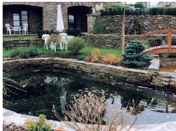
Rochehaut, hôtel "Auberge de la ferme"

Des dimensions hors standard ainsi que des conseils de pose et d'entretien peuvent être obtenus en faisant appel directement au producteur.