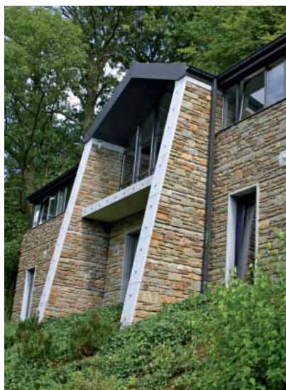
Tiff - Arch. Hardy