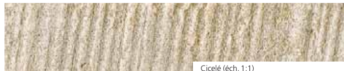
Cicelé (éch. 1:1)