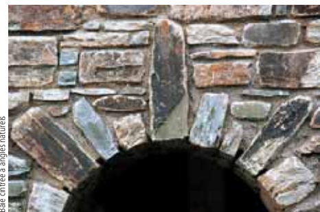
Baie cintrée à angles naturels