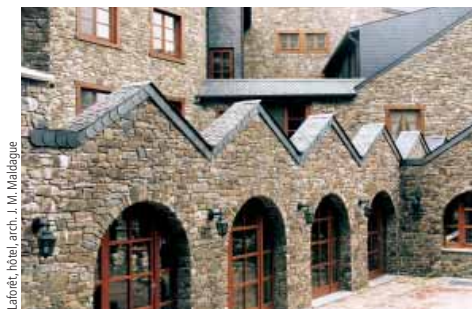
Laforêt, hôtel, arch. J. M. Mardagne