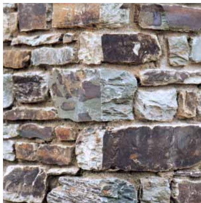
Détail d'un angle