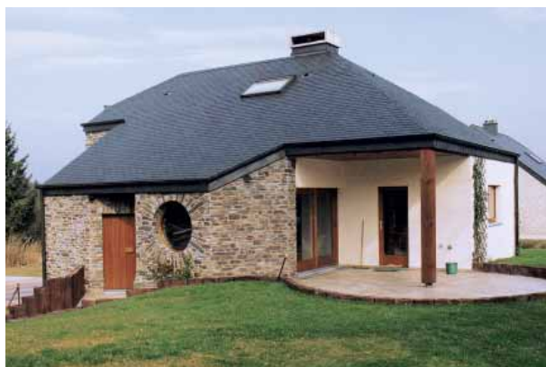
Herbeumont, maison privée, arch. M. Lepère

Des dimensions hors standard ainsi que des conseils de pose et d'entretien peuvent être obtenus en faisant appel directement au producteur.