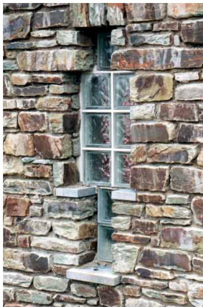
Floramille, prise de lumière d'un garage, arch. R. Devisemaison