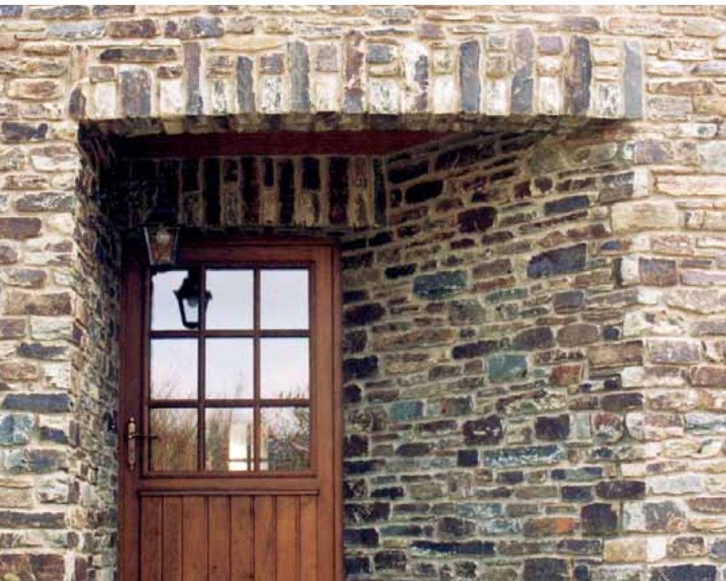
Herbeumont, maçonnerie de parements semi-fins, arch. M. Lepère