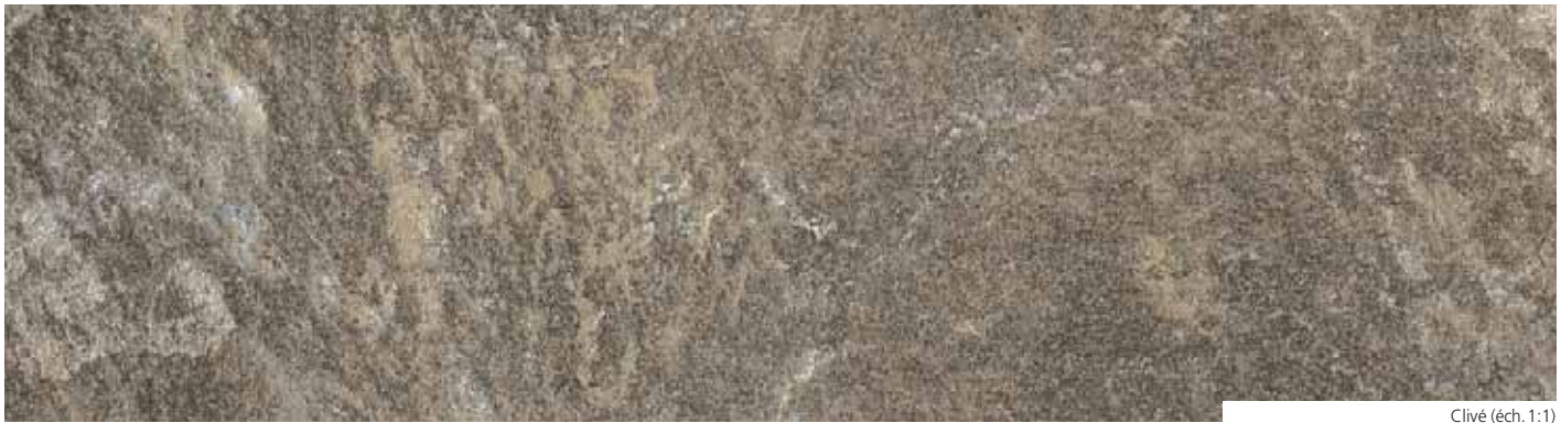
Clivé (éch. 1:1)