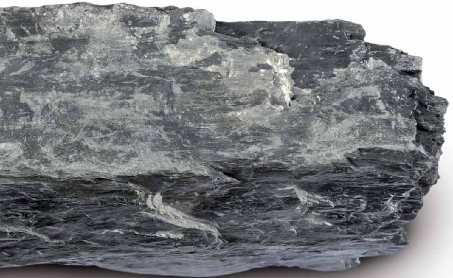
Bruchstein (Maßstab 1:1)