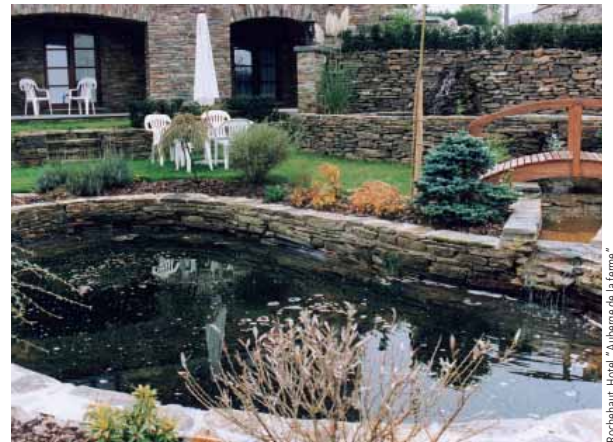
Rochehaut, Hotel "Auberge de la ferme"

Auskünfte über Sondergrößen und praktische Ratschläge zum Verlegen und Unterhalt sind beim Produzenten direkt erhältlich.