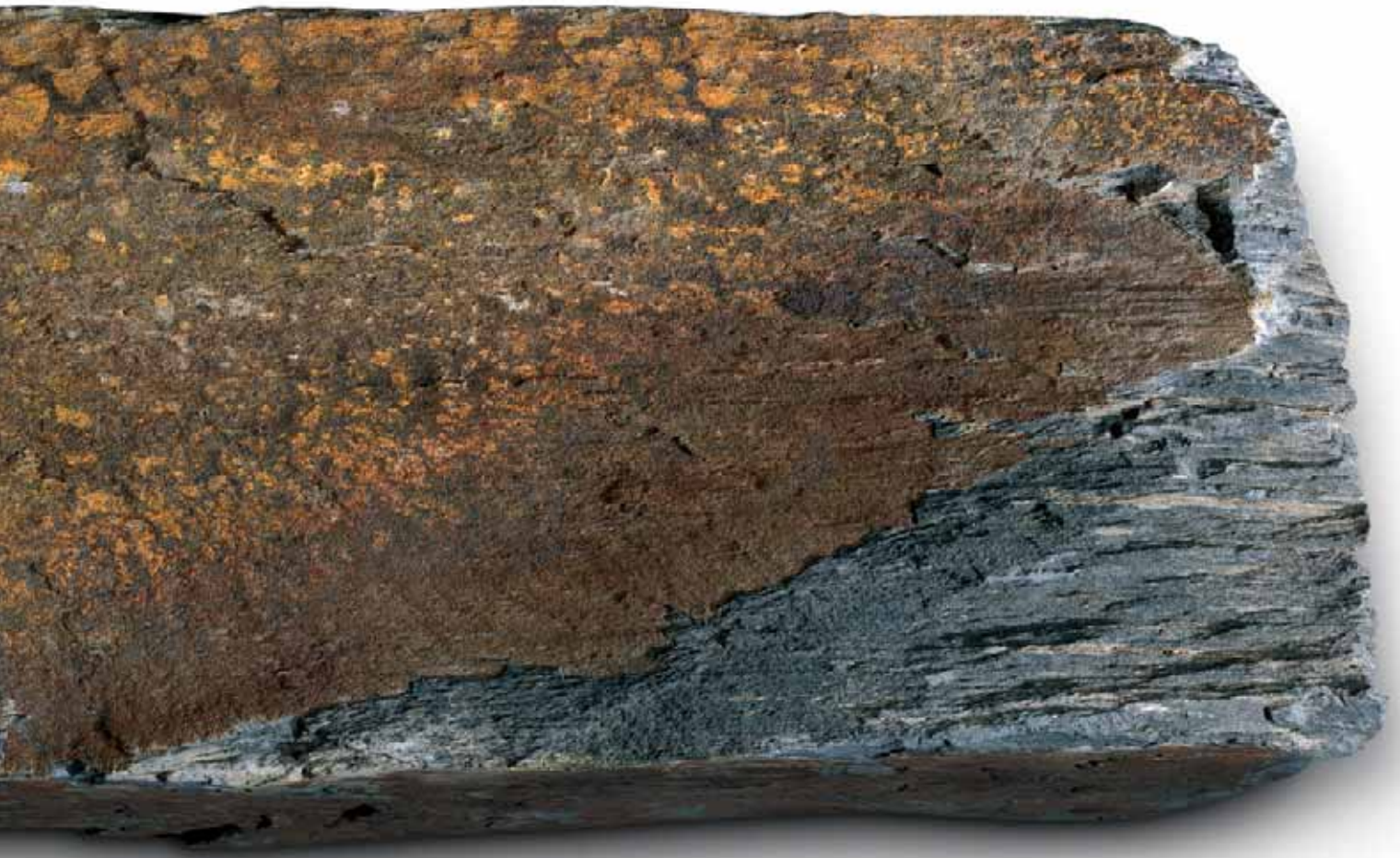
Bruchstein (Maßstab 1:1)