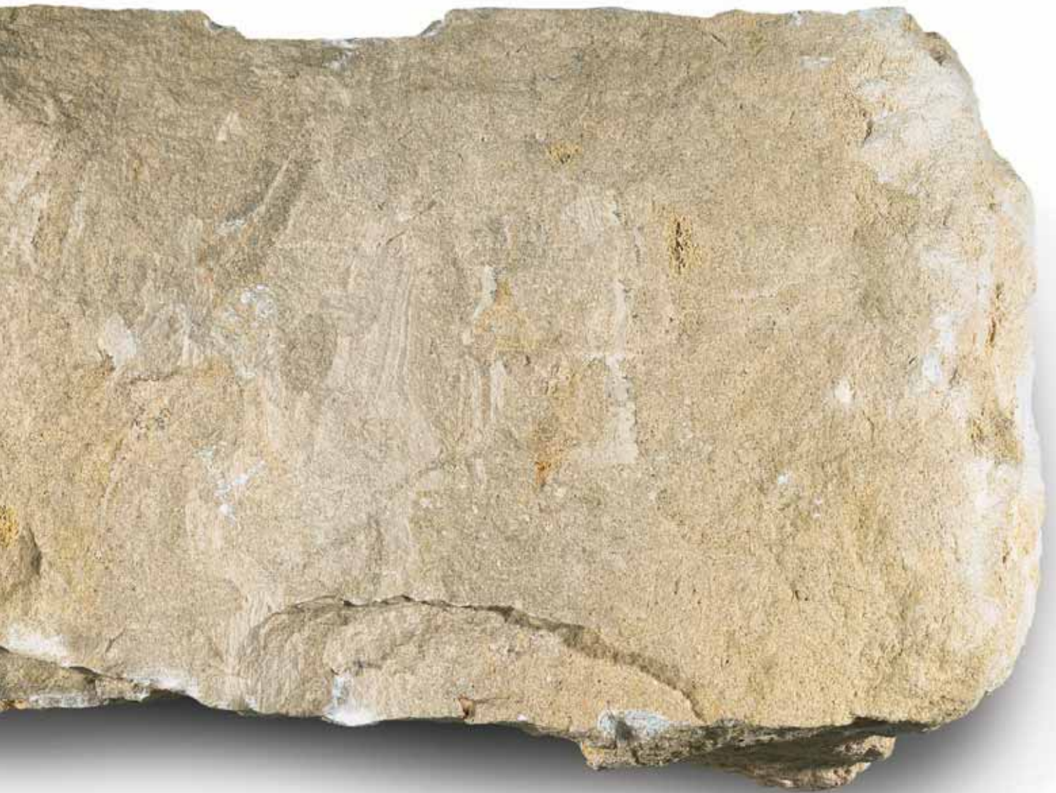
Bruchstein (Maßstab 1:1)