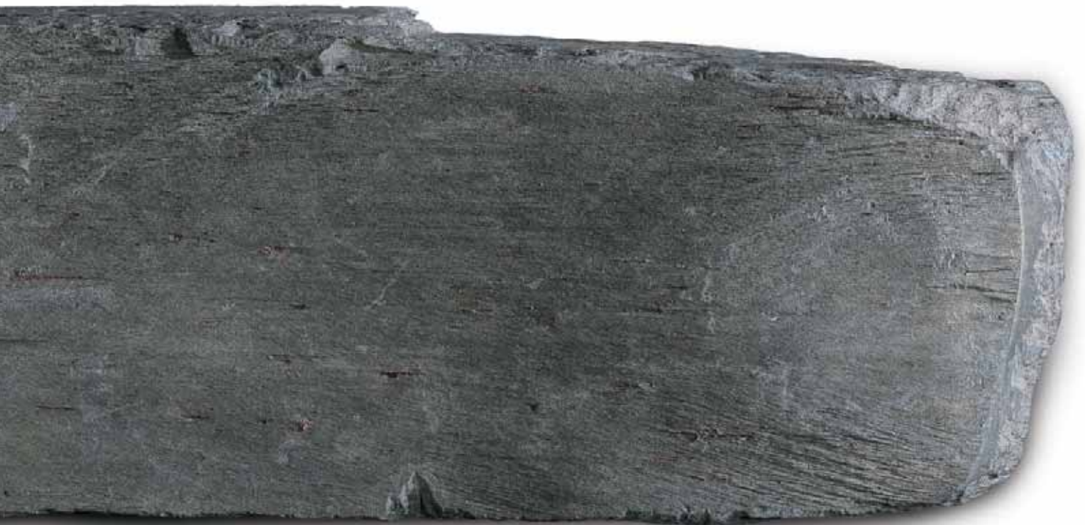
Bruchstein (Maßstab 1:1)